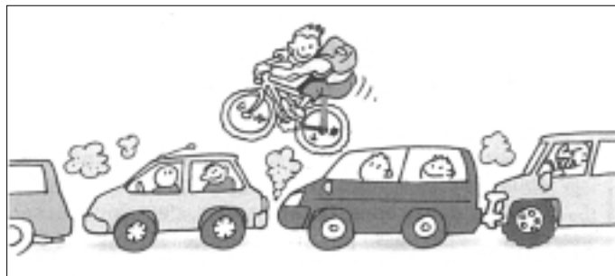
Dessin de Gérard Thèves dans "Lettre de l'éco-consommation"

Il est vrai que les infrastructures adaptées aux vélos font encore cruellement défaut. Il existe un gros déficit en pistes cyclables, itinéraires cyclables, aménagements ponctuels, carrefours, marquage au sol, "SUL" - sens uniques limités. Chaque année viennent s'ajouter des circuits RAVEL, ces voies lentes réservées aux cyclistes, piétons et cavaliers qui rencontrent un succès grandissant.