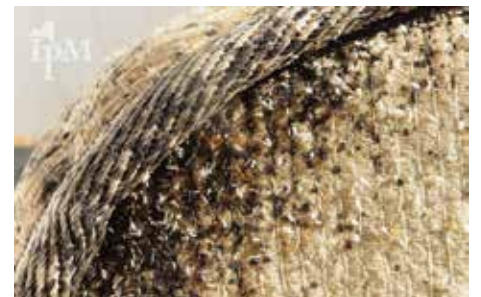
Matelas infesté de punaises de lit

Lire : comment se débarrasser des punaises de lit