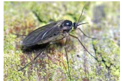
Mouche du terreau (sciaride)

noir de 4 mm de long, qui s'envole de vos pots lorsque vous le dérangez.