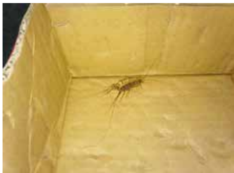
Scutigère véloce

Dans les maisons, on peut aussi rencontrer des myriapodes et des chilopodes (scutigères par exemple), surnommés mille-pattes, et qui ne sont pas des insectes . Les scutigères véloces ( Scutigera coleoptrata ) sont assez fréquentes dans les tas de bois stockés à l'intérieur (à proximité des cheminées ou des poêles à bois), ainsi que dans les lieux sombres et humides (salles de bain, cuisines) ; très rapides, elles fuient la lumière et l'homme, pour qui elles sont quasiment inoffensives. Les scutigères sont utiles : elles sont des prédateurs d'insectes indésirables (punaises, fourmis, blattes, termites, moustiques...). Ne les détruisez pas et laissez-les vivre leur vie discrète !