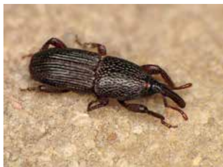
Charançon du blé

Il existe de nombreuses espèces de charançons, qui sont des coléoptères ravageurs. Celui qui nous intéresse ici est le charançon du blé, Sitophilus granarius , un minuscule insecte de 2 à 3 mm de long, de couleur brun-noir. Il se nourrit de céréales (grains, flocons, farines, pâtes...). Pour vous en prémunir (ce conseil vaut pour tous les insectes ravageurs des denrées alimentaires sèches), placez toutes vos céréales et vos produits d'épicerie dans des boîtes hermétiques, métalliques ou en plastique.