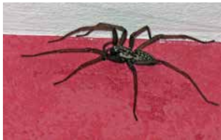
Araignée de maison (tégénaire domestique) - (Christophe Quintin / flickr.com)

Celle qui vient en premier lieu à l'esprit est l'araignée (qui n'est pas un insecte, mais un chélicérate ; les insectes ont 6 pattes, l'araignée en a 8). Mal aimée et crainte, elle fait souvent l'objet de phobies et beaucoup ne supportent pas sa présence dans les lieux d'habitation. Pourtant, l'araignée est la plupart du temps totalement inoffensive pour l'homme, aussi bien dans la maison qu'au jardin, et elle a l' immense mérite de se nourrir d'autres «petites bêtes» plus embêtantes (mouches, moucheron, moustiques, punaises...).