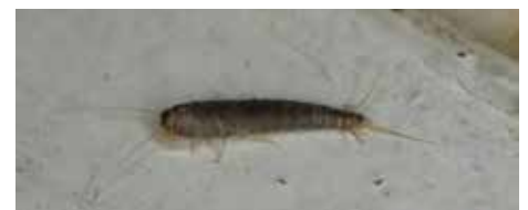
d'acariens, de moisissures, de cheveux... Lepisma saccharina, poisson d'argent

Lepisma saccharina, le lépisme, surnommé poisson d'argent en raison de son corps dépourvu d'ailes et couvert d'une carapace gris argenté semblable à des écailles, est un petit insecte de 1 à 1,5 cm de long, aussi agile que discret. Il a une activité nocturne et vit dans les pièces chaudes et humides (salles de bain, cuisines, buanderies). Il se reproduit peu (sa présence est donc assez rare) mais peut vivre 3 ans. Son régime alimentaire fait de lui l'insecte le moins embêtant dans la maison : il se contente de se nourrir de poussière, de cellulose,