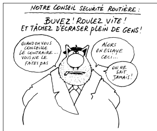
Extrait du "Quatrième Chat" de Philippe Geluck aux Editions Casterman

Ces conducteurs qui peuvent être des gens charmants "hors automobile" sont souvent très intolérants pour leurs frères et soeurs à 2 ou 4 roues. (suite page 2)